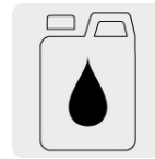
Aceite monogrado SAE30