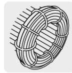
Motor con bobinas de cobre