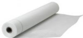
Malla de refuerzo para repello Cementicio