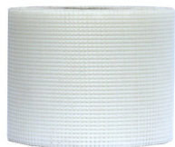
Malla para juntas