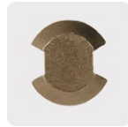
Punta de cruz