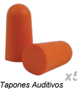
Tapones Auditivos x5