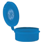
Estuche de Almacenamiento