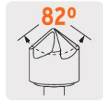
Ángulo de punta