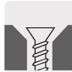
Ocultar la cabeza del tornillo