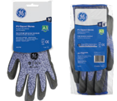
Tarjeta Colgante 12-Pack