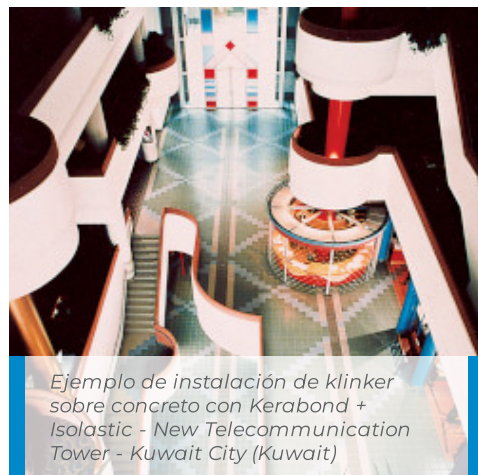
Ejemplo de instalación de klinker sobre concreto con Kerabond + Isolastic - New Telecommunication Tower - Kuwait City (Kuwait)