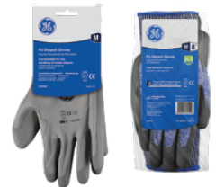
Tarjeta Colgante 12-Pack