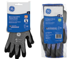
Tarjeta Colgante 12-Pack

• Recubrimiento de Microespuma de Nitrilo Negro