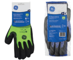
Tarjeta Colgante 12-Pack

• Recubrimiento de Nitrilo Arenoso Negro