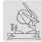
Para sierra de inglete