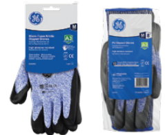
Tarjeta Colgante 12-Pack

• Recubrimiento de Microespuma de Nitrilo Negro