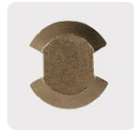
Punta de cruz