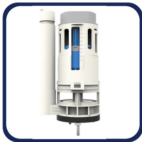
Válvula de descarga