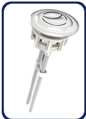
Un Botón independiente Doble acción para instalarse en la tapa superior del tanque