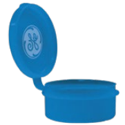
Estuche de Almacenamiento