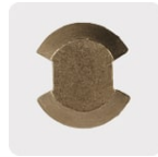
Punta de cruz